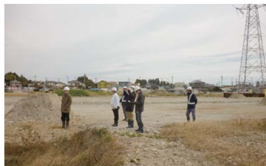
Fig.1 プロジェクト実施対象地視察の様子

各府省庁の競争的資金等支援制度として、経済産業省(NEDOを含む)、環境省、農林水産省、厚生労働省、国土交通省等が募集するものが多いのですが、文部科学省(JSTを含む)が募集するものにも数多くあります。