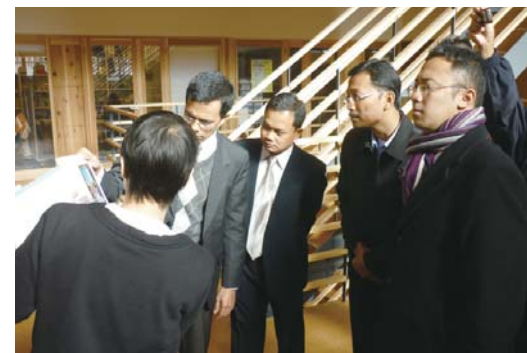
Fig.2 プロジェクトの広報支援

戦略支援室では、上記研究支援と同じように支援業務を行いますが、それに加えて、共同研究企業の紹介、共同研究の場としての自治体との繋ぎを含めて、企業と住民の両方に還元するためのコンソーシアム構築等のお手伝いも致します。環境科学研究科ミッションとして重要である「環境保全、環境改善、住民生活の質の向上」を目指して、現在以下のプロジェクトが実行されており、プロジェクトの運営、予算管理等の支援活動をしております。