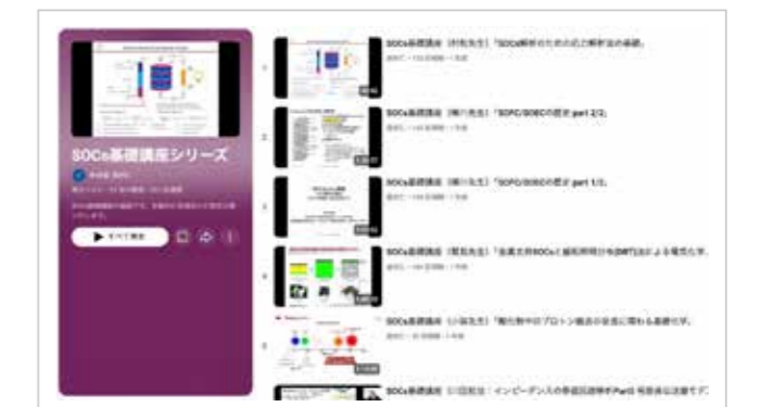
Fig. 4 List of Short Technical Explanation Videos for Member Companies.

During the current fiscal year, two open science events were organized. On July 25, a basic lecture course was held in the Ecolab main conference room, followed by an international workshop on November 7 at the Graduate School of Environmental Science main building. At the international workshop in November, two researchers were invited not only from Japan but also from the Republic of Korea. They delivered lectures on recent research and development trends in solid oxide cells in Korea, introduced cutting-edge research topics, and provided instruction on analytical methodologies. In addition, a book supervised by our center, "SOFC/SOEC Technologies for Carbon Neutrality: From Fundamentals and Evaluation Methods to System Applications Including Thermal Utilization," was published by CMC Research. Furthermore, since the first year of operation, we have continued to distribute paper reviews and short explanatory videos for member companies on an irregular basis.