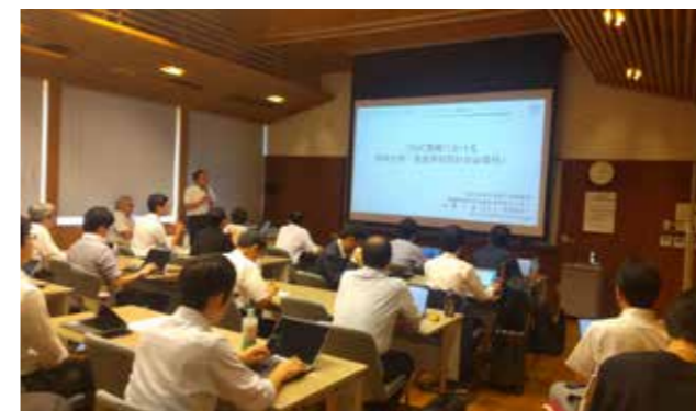
Fig. 3 Scenes from the Open Science Event at the SOC Center.

今年度は、オープンサイエンスイベントを 2 回実施した。7 月 25 日にはエコラボ大会議室にて基礎講座を、11 月 7 日には環境科学研究科本館にて国際ワークショップを開催した。(Fig. 3) このうち 11 月の国際ワークショップでは、日本国内にとどまらず、韓国からも 2 名の研究者を招聘し、韓国における固体酸化物セルの研究開発動向に関する講演をはじめ、最先端研究の紹介や解析手法に関する講義を提供いただいた。また、当センターが監修した書籍『カーボンニュートラルのための SOFC / SOEC 技術 - 基礎・評価法から熱利用を含むシステム応用まで -』が、シーエムシー・リサーチ社より発行された。このほか、初年度から継続して、会員企業向けに論文紹介やワンポイント解説動画の不定期配信 (Fig. 4) を行っている。