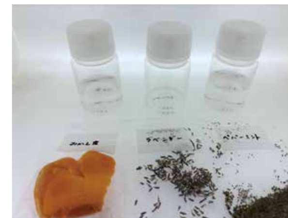
Fig. 4 Results of prediction of retention time with separated chemicals on supercritical fluid chromatography.