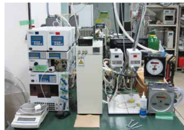
Fig. 3 Flow-type subcritical fluid separation apparatus

今年度は、化学物質の揮発性を表現する無次元数 apVP 値を導くことに成功した。また、eSPT-PR EoS という独自の視点からの状態方程式の開発にも成功した。その一方で、これまでの成果・業績をまとめた著書「広がる超臨界・亜臨界研究の世界～基礎的理論と解析～」も無事発刊することができた。この著書に基づき、教育研究活動にもこれから力を注いでいきたい。今年度も継続して、旧スミス リチャード研究室を修了した新潟大学 小松博幸 助教との共同研究を推進することができたことは大きな成果となった。