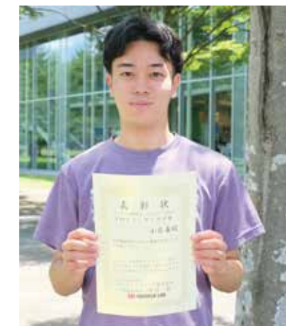
Fig. 5 Photo of the award winner.