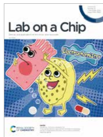
Fig. 2 Electrochemical microphysiological systems for a gut model.