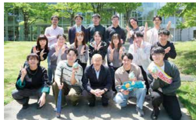
Fig. 1 Photo of the members in 2025.

When cells are three-dimensionally cultured, they form cell aggregates known as cell spheroids. These spheroids are widely used in regenerative medicine and microphysiological systems because their functions closely resemble those in vivo. For these applications, it is important to evaluate cellular functions in a high-throughput manner. In this study, we developed a novel strategy to measure biomolecules produced by spheroids using electrochemiluminescence microscopy (Fig. 3). Compared with simple electrochemical devices, this strategy enables high-throughput and spatially resolved assays.