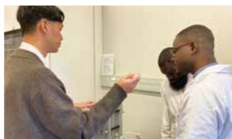
Fig. 2 Technical guidance in the SATREPS project