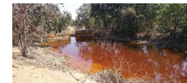
Fig. 5 Acid mine drainage

Research funding has been secured for research on semiconductor industrial wastewater treatment using waste materials and environmental purification using porous geopolymers as recycled materials. This research is intended to realize cross-industry resource circulation through the recycling of various waste. Additionally, research on the effective utilization of seawater-related industries and seawater resources integrated with carbon neutrality is currently underway.