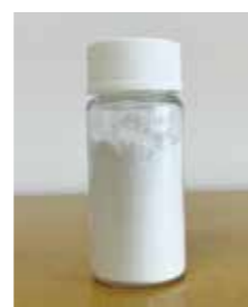
Fig. 3 Calcium carbonate produced by mineral carbonation technology