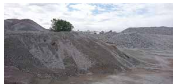
Fig. 1 Demolished concrete in Africa

本分野では、塩基性副産物/廃棄物中の塩基性のカルシウム/マグネシウム化合物を利用して、CO 2 を安定な炭酸塩に転換する炭酸塩鉱物化技術について広く研究を行っている。地球規模課題対応国際科学技術協力プログラム(SATREPS)による南アフリカ共和国との共同研究を推進している(2020-2026年度)。2025年には3回の相手国への渡航を行った。炭酸塩鉱物化のためのパイロットプラントを含む各種機器の供与と設置が終了し、相手国での研究活動が活発化している。また、連続式での効率的な炭酸塩鉱物化反応の達成を目指した特殊形状の反応流路の開発に関する基礎的な検討も、科研費(2023-2025年度)の支援を受けて進めている。また、NEDO GI基金の支援を受けた技術開発も実施中である。炭酸塩鉱物化技術については、共同研究で計6件の論文(Ho et al., 2025a, b, Ho and Iizuka, 2025a, b, Zide et al., 2025,