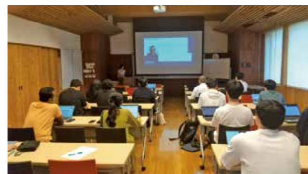
Fig. 3 Lecture by Prof. Silvia Spriano