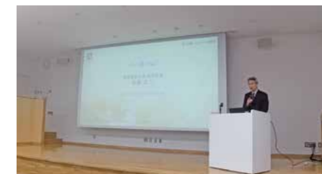
Fig. 4 Lecture by Prof. Koji Ioku