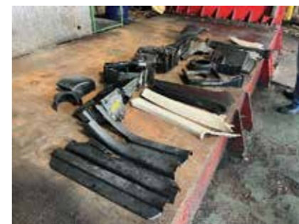
Fig. 2 Dismantled Plastic Parts as a Recyclable Material from ELV (End-of-Life Vehicles)