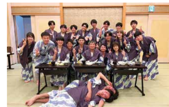
Fig. 4 Group photo of summer trip