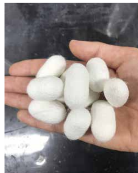
Fig. 3 Cellulose nanofiber reinforced cocoon of a silkworm.

impact. We have also established a technology to embed twisted Fe-Co wires in aluminum alloy and developed a light metal composite material that converts impact into electricity. Furthermore, we are investigating the changes in resonant frequency and output power of magnetostrictive composites caused by material adhesion, aiming to develop magnetostrictive virus sensors (see Fig. 2).