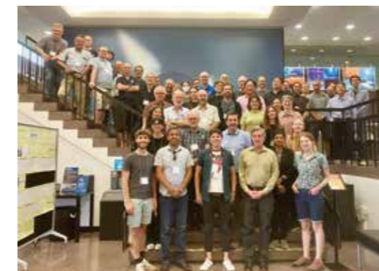
Fig. 3 Group photo of the NDACC/IRWG meeting held in Boulder, U.S.A.

村田は 2015 年から宮城県保健環境センターの評価委員をしており、今年も 2 回の評価委員会に出席して県保健環境センターが行っている研究の評価を行った。また、2020 年から宮城県環境影響評価技術審査会委員もしており、今年も 4 回の審査会に出席した。