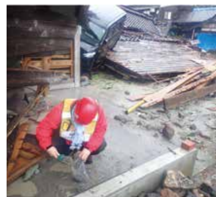
Fig. 1 Field survey in Noto Peninsula (March, 2024), Tsunami deposit.