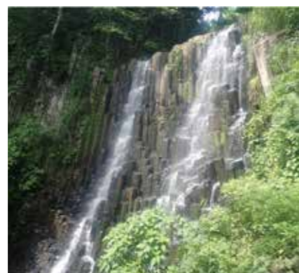
Fig. 2 Geothermal survey in El Salvador (June, 2024), Beautiful Columnar Joint and Water Fall.