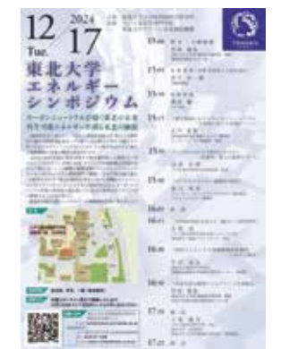
Fig. 6 Tohoku University Energy Symposium held in Hachinohe Kosen in Dec. 17th, 2024