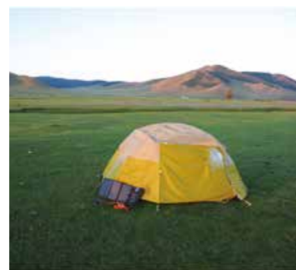
Fig. 3 Field survey in Mongolia (August, 2024). Solar panel is useful gear for recent field survey.