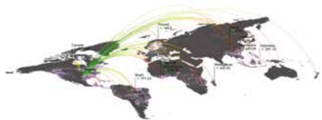
Fig. 2 Deforestation footprint of nations