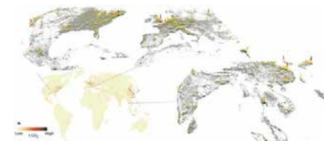
Fig. 4 Carbon footprint of 13,000 cities