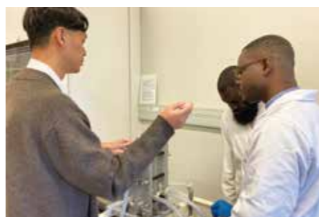
Fig. 2 Technical guidance in the SATREPS project