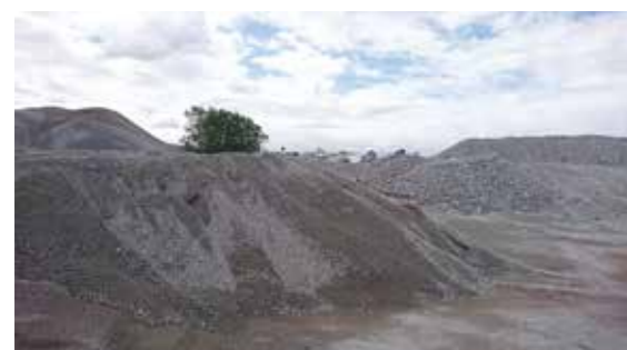
Fig. 1 Demolished concrete in Africa

The research topic on efficient treatment and resource circulation technology for semiconductor industrial wastewater has been adopted by HABATAKU Young Researchers Support Program, Tohoku University. This research aims to realize cross-industry resource circulation through various waste recycling. The use of functional mineral materials on semiconductor wastewater has also been initiated. In addition, the development of porous geopolymer prepared from industrial waste as an environmental remediation material was initiated.