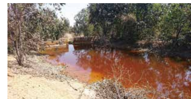
Fig. 5 Acid mine drainage