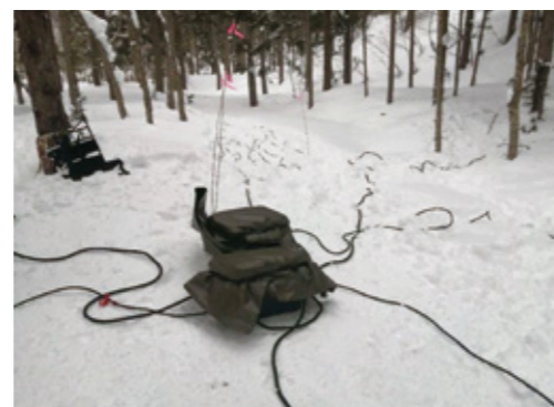
Fig. 2 MT observation in winter season