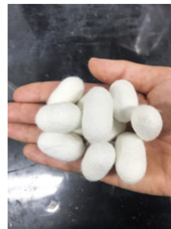
Fig.3 Cellulose nanofiber reinforced cocoon of a silkworm.