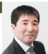
教授 成田 史生 Professor Fumio Narita

Design, development and evaluation of multi-functional composite materials