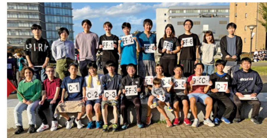
Fig.4 Group photo of the marathon race