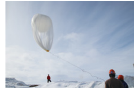
Fig.3 The first launch on January 6.