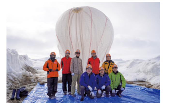
Fig.4 Group photo of the launch members.