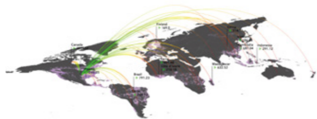
Fig.2 Deforestation footprint of nations

の木材の輸入をすべて停止するわけにはいかない。そこで、インドネシアのどこで伐採された木材が種を絶滅の危機に晒しているのかという地理情報をサプライチェーンと組み合わせる研究を行ってきた。