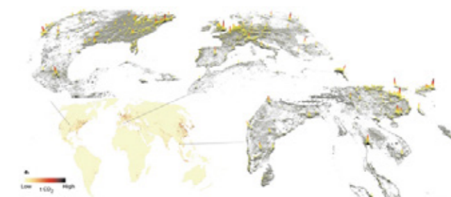
Fig.4 Carbon footprint of 13,000 cities