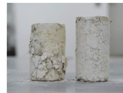
Fig.5 Modified soil by EFB