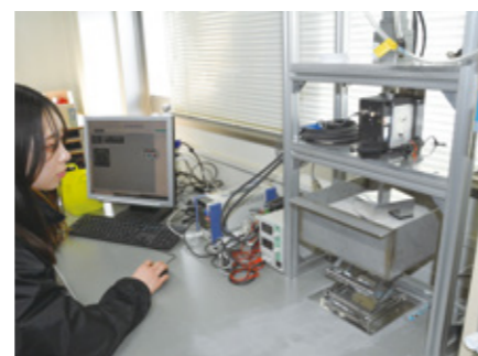
Fig.3 Apparatus for rotation torque

(4) ミニショベルを用いたフィールド試験：宮城県大崎市三本木町のフィールドにおいて、3トンのミニショベルを用いた地盤掘削実験を行った。実験では、ミニショベルのシリンダに圧力センサおよびストロークセンサを設置し、掘削に伴う圧力変化を計測するとともに、シリンダに作用する力から地盤強度を推定する手法について検討した (Fig.4)。