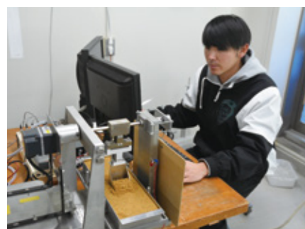
Fig.1 Apparatus for bucket excavation