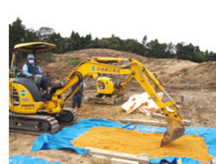
Fig.4 Filed experiment using mini-shovel

2019 年よりスクリー式土砂サンプリング装置の開発を目指した研究を行っているが、本年は反力を取りながら 30cm の深さまでスクリーを貫入できる装置を作成し (Fig.6)、スクリー貫入試験を行った。その結果、装置を地面に設置した後、反力を取りながら目標の 30cm までスクリーを貫入し、土砂をサンプリングできることを確認した。また実際の海岸で試験を行い、屋外でも稼働することを確認した。