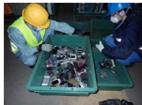
Fig.2 Survey research on the actual situation regarding E-waste.

Starting this year (2020), our laboratory is mainly focusing on the development of the environmental friendly materials and their application. Moreover, we try to research and match the academic seeds and company needs. For example, virus and/or heavy metal ions, which are widely splatted to environmental conditions, are seriously affected by our society because they are difficult to collect. To solve these problems, magnetic beads were developed recently. As shown in the Fig. 1 schematic drawing, the specific functional groups, which are attached on the new material's surface, interact with the specific substance. In our laboratory, to develop the highly effective magnetic bead, well-stabilized core materials with the high performance are synthesized under room temperature conditions by using simple equipment and by controlling the reaction potential through the management of the metal complex condition in an aqueous phase. We are planning to check these abilities for the collection of various pollutant materials and present these results in international/domestic conferences beginning next year.