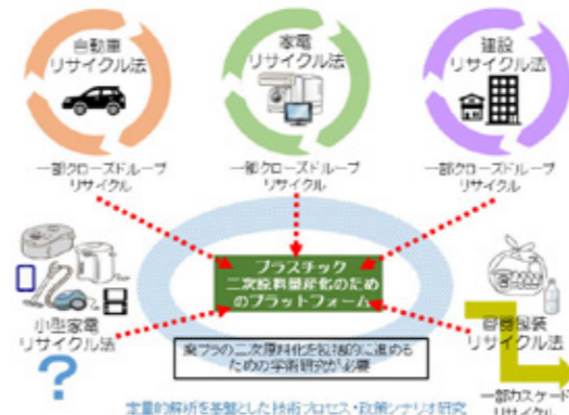
Fig.3 Platform for the recycling of secondary plastic resources.

資源のリサイクルや資源回収の研究分野において、目的とする元素の種類や回収率向上のみならず、共存する不純物の安全かつ経済的な分離濃縮・固定化技術の開発も、大変重要な研究課題である。当研究分野では、資源開発や製錬事業に係る環境政策の提案を目指して、環境浄化、特に製錬事業に関わる環境修復技術の開発とその展開を進めると共に、環境リスク管理に係る研究および連携研究・調査を進め、さらに環境調和的な資源開発に関わる研究開発を進めることを検討している。具体的には、銅・亜鉛・鉛を始めとする非鉄金属製錬業における副産物としてのヒ素・カドミウム・水銀等について、経済的かつ安定的な管理技術の高度化を目指し、技術と社会の両面から研究・調査を行っている。