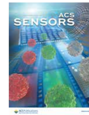
Fig.5 Our research featured on the cover of ACS Sensors