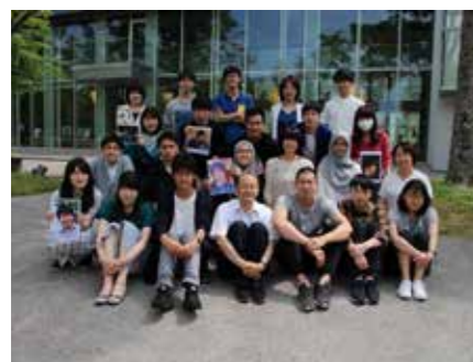
Fig.1 Lab members 2019