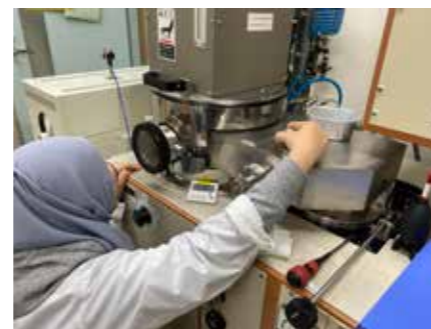
Fig.3 Microdevice fabrication