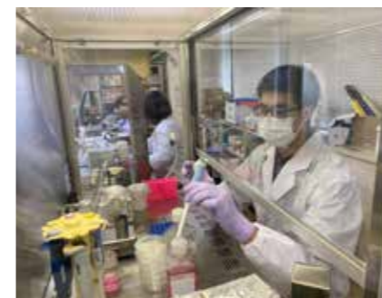
Fig.4 Cell culture in a bio-safety hood