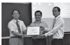
ホーチミン市工科大学(ベトナム)