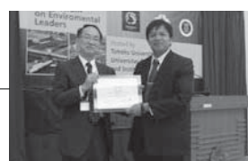
ガジャマダ大学(インドネシア)