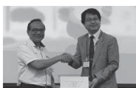
マレーシア工科大学(マレーシア)