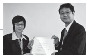
上海交通大学(中国)