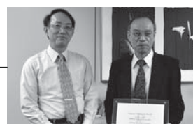
バンドン工科大学(インドネシア)