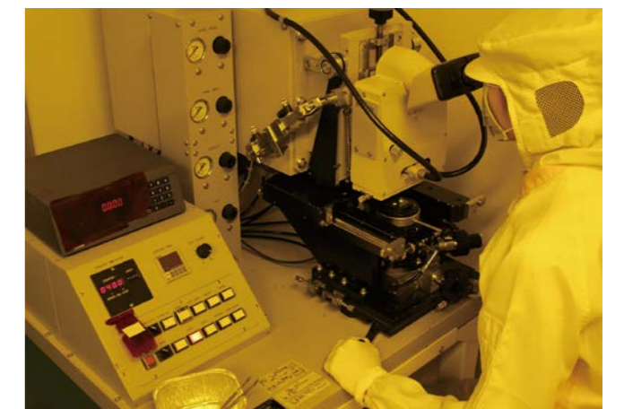
Fabrication of a chip device