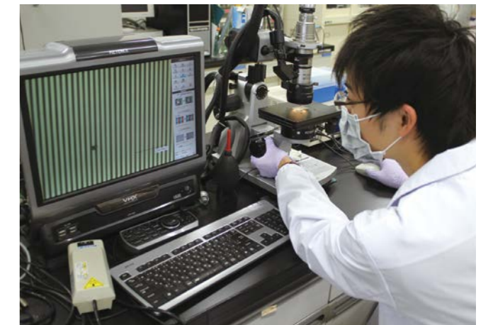
Evaluation of a chip device