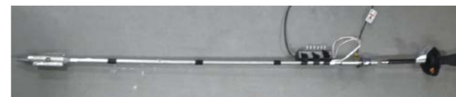
Fig.4 Developed test device composed of cone, vane and earth pressure gauge to estimate soil shear strength property.

災害復旧工事を迅速かつ安全に行うためには、建設機械の自動化施工が望ましい。施工では原位置におけるせん断強度定数が必要であり、一般的にせん断強度定数はサンプリング試料による室内試験から求められるが、多大な労力を要する。そこで、原位置で測定可能なパラメータを用いた推定モデルを構築するため、コーン、ベーンおよび土圧計を組み合わせた装置を作製し、原位置のせん断強度定数を推定した。本成果は、11月にニューデリーで開催された第9回実験力学に関する国際シンポジウムで発表した(Fig.4)。