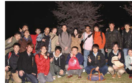
Cherry blossom viewing at Nishi Koen Park