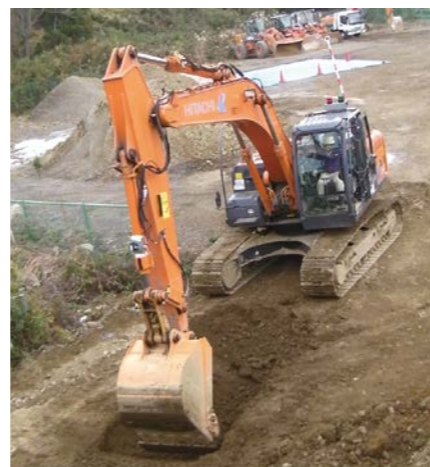
Fig.3 Soil excavation test by hydraulic power shovel with different soil strength characteristics.

自動制御機能を有する油圧ショベルのパラメータ調整を自動化するためには、油圧ショベル自らが掘削時の土質の状態を自動的に把握する必要がある。昨年は、各種センサが装備されている実機を用いて地盤の掘削実験を行い、掘削時の油圧データを収集するとともに、自動制御に最適な油圧シリンダを決定した。本年は、真砂土および粘土を用いて様々な強度を有する地盤を作製し、掘削実験を行うとともに、シリンダからの信号を基に地盤強度を推定する方法について検討した。本成果は、11月にニューデリーで開催された第9回実験力学に関する国際シンポジウムで発表した(Fig.3)。