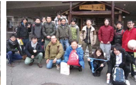
Yearend party at Akiu Onsen

In 2014, the research activities of this laboratory are as follows: