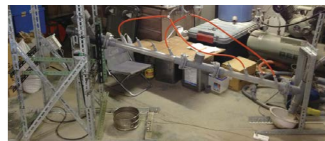
Fig.5 Experimental apparatus to separate soil from crushed asphalt under grizzly with a vibration mechanism.

道路補修工事現場から排出されるアスファルトガラをアスファルト舗装用の再生骨材として利用する場合、初めにグリズリーと呼ばれる大型の篩で分級される。グリズリーアンダー材は、アスファルト含有骨材が多く含まれているものの、全体の土砂分は5%以下であるという法的基準をクリアしていないため、付加価値の低い路盤材にしか活用されていないのが現状である。本研究室では、自然落下式に旋回流を付加した土砂分離装置の開発を進めており、本年は土砂分離管に振動を付加し、グリズリーアンダー材の滞留時間を増加させることにより土砂分離効率を増大させる実験を行った(Fig.5)。