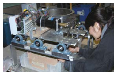
Fig.1 Developed apparatus to continuously recycle high-water content mud generated from disaster sites.

近年、東日本大震災や度重なる大型台風の襲来など大規模自然災害が多発している。自然災害では大量の軟弱泥土が発生することが多く、この軟弱泥土が迅速な災害復旧の障害になっているのが現状である。そこで、昨年より「災害復旧対応型泥土処理システム」の開発を目指した基礎研究を開始した。本年は、昨年度に検討した攪拌羽を用いて攪拌装置を作製し、繊維入り