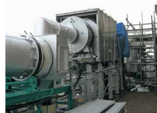
Fig.2 Microwave rotary kiln for treatment of asbestos.