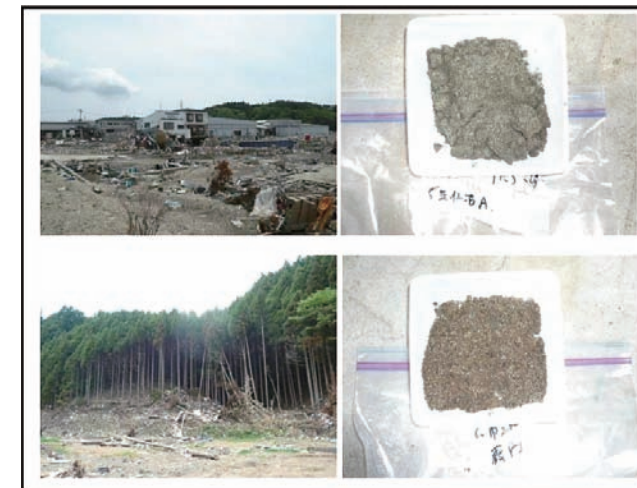
Fig.2 Geological survey and sampling of tsunami sediments at coastal areas in Miyagi Prefecture.

沿岸部で採取した津波堆積物について化学分析を行った結果、一部の地域でヒ素などの有害元素の濃度(溶出値)が比較的高いものの、全体的に含有量、溶出量の基準値を下回り、地球化学的なバックグラウンドと大差がないとの予察の結果が得られた。