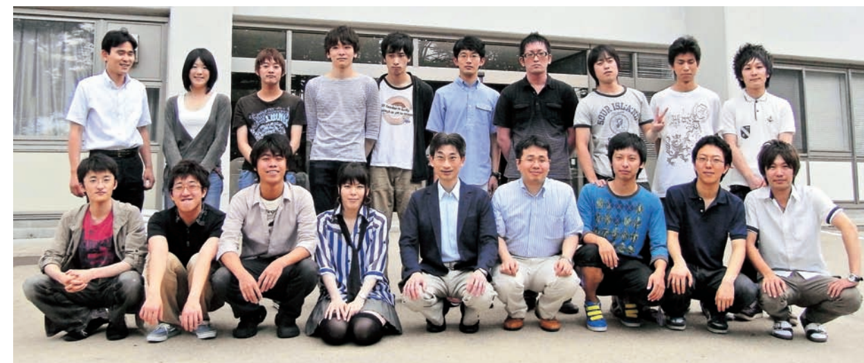
Group photograph of Ioku Lab.