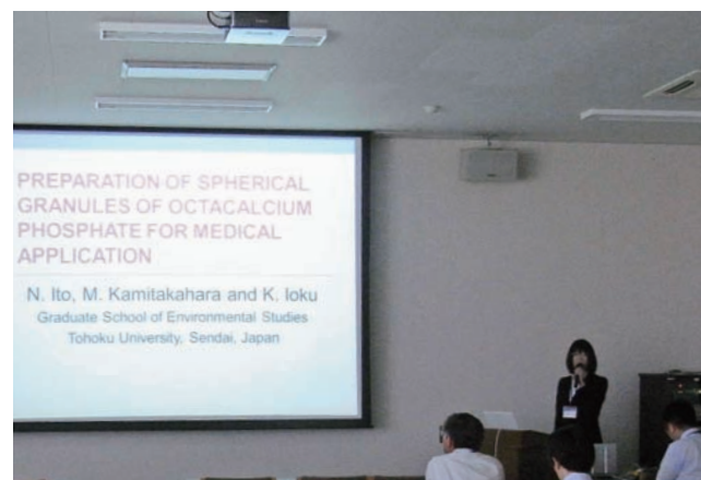
Fig.1 Presentation by a student on an international conference (ISFM2011).

軽減できます。この観点から、生命機能物質を含有させたアパタイトのカテーテル等の表面への被覆を行いました。動物実験レベルでも、着実な効果が確認されています。産業技術総合研究所との包括協定に基づいて研究を進めています。