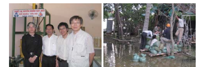
fig.4 ホーチミン市工科大学にて