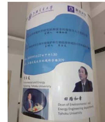
fig.1 上海交通大学にて

Visit China: Tsinghua University (2010.12)