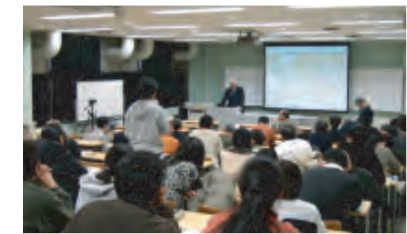
Participants at the workshop