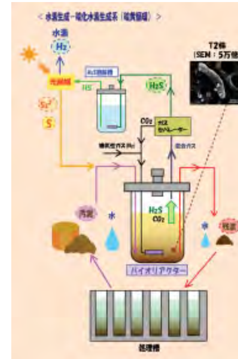
硫酸還元細菌を利用した水素生産システム