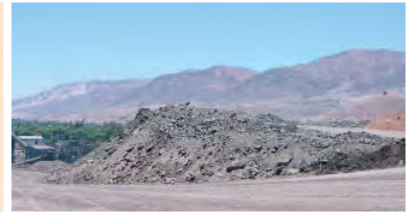
バイオリッチングに有用な微生物の探索