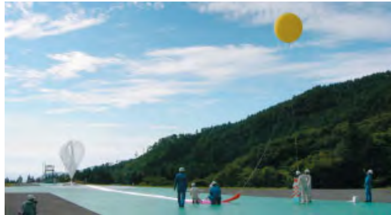
写真1. 三陸大気球観測所での放球風景。左手の滴型の部分がヘリウムガスが注入された気球の頭部