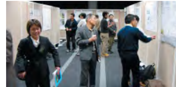
写真5. ポスターセッション

非常に高分解能なため、大気微量成分による吸収線の形状を利用するとインバージョン法により地上観測から高度分布が導出可能である。しかし、我々の分光器はこの高度分布導出時に重要な装置関数が理想的な状態からはほど遠く、昨年度から光軸調整を進めている。ニュージーランドの大気水圏研究所で学んできたレーザーフリンジを利用する方法で調整したところ、吸収線の対称性はかなり良くなったが分解能はかえって悪くなってしまった。そのため、再度調整し試行錯誤の結果、焦点調整により分解能はやや戻ったが、まだ以前より悪い状態であり、さらに調整をする予定である。なお、装置関数が不完全でも全量観測にはあまり影響がないため、つくばでの観測も継続して行っている。