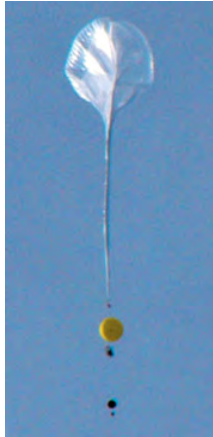
写真3. 放球直後の大気球。黄色いゴム気球の下に二つ見えるのがECC及び光学式のオゾン観測器。なお、このゴム気球は放球作業を安全に行うためにロープ等をつり上げていたもの。

当研究室では、「グローバルな環境変動」をキーワードに、オゾン減少問題や地球温暖化など、地球規模の環境変動に関わる大気中の微量成分の観測的研究を行っている。2005年度は、昨年度に引き続き光学オゾンゾンデを用いた上部成層圏オゾン高度分布観測およびフーリエ変換型分光計を用いた大気微量成分の地上赤外分光観測などを行った。また、北極圏の環境変動に関する国際会議を東京で開催した。