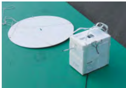
写真2. 放球直前の光学オゾンゾンデ。白い円盤は気球からの反射光を遮る遮光板。観測器の大きさは25×25×17cm、重量は2.2kg。