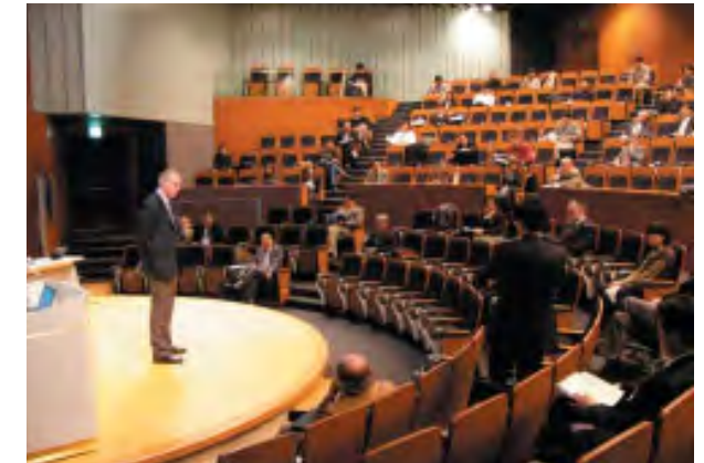
写真4. GCCA-6での議論風景

12月12-13日に、東京の日本科学未来館において6th International Conference on Global Change: Connection to the Arctic (GCCA-6)（第6回地球温暖化と北極域の気候・環境変動に関する国際会議）を開催した。会議の運営は複数の大学・研究機関のメンバーで協力して行っ