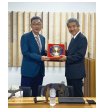
Fig. 6 Visit from University Science and Technology Beijing.