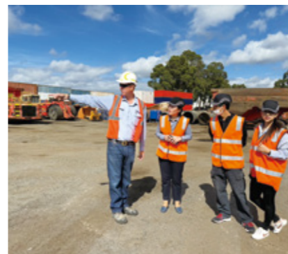
Fig. 4 Workshop at a mining company in Australia.

世界の社会経済活動の全面的な再開に伴い、当研究室は、物質循環や資源採掘や半導体製造に伴う環境負荷、食料を通じて生じる栄養塩のフットプリント、資源の国際的なサプライチェーン解析などの分野において国際的な学術活動に参加し、建設的な議論を交わすと同時に、国際ネットワークングをしてきた。例えば、オランダのライデン大学で開かれた The 11th International Conference on Industrial Ecology (Fig. 2)、ガーナの SETAC Africa 11th Biennial Conference (Fig. 3)、ケンブリッジ大学の Net Zero and Sustainability Forum 2023、ストックホルム大学及びオーストラリアのカーティン大学のワークショップ (Fig. 4) がある。また、アリゾナ州立大学 (Fig. 5)、清華大学や北京科技大学 (Fig. 6)、国際応用システム分析研究所などからの専門家が訪問し、今後の国際的な連携協力を促進した。