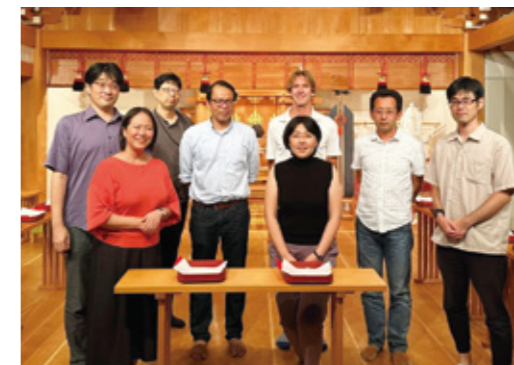
Fig. 5 Visit Prof. Datu from Arizona State University.