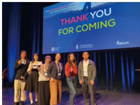
Fig. 2 Participation in the International Conference on Industrial Ecology.