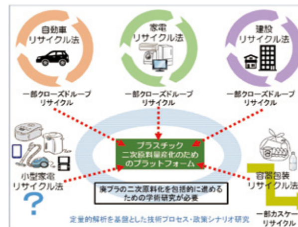
Fig.2 Building a platform for secondary raw materials

本分野は、資源開発や製錬事業に係る環境政策の提案にふさわしい環境浄化・環境修復技術の開発とその展開を進めると共に、環境調和的な資源開発に貢献する研究開発を進めることを検討している。具体的には、非鉄金属製錬過程の排水に含まれる金属を、微生物による除去・回収する新しいプロセス開発に取り組みでいる (Fig.3)。