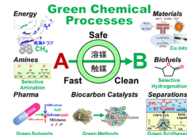
Fig.2 Green Chemical Process