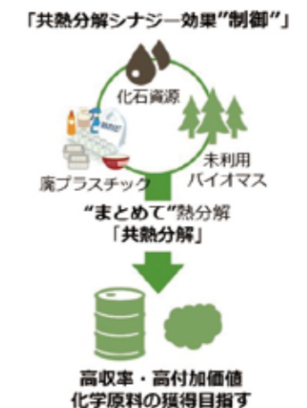
Fig.4 Highly efficient utilization of carbon resources by the control of pyrolytic synergistic interactions during co-pyrolysis