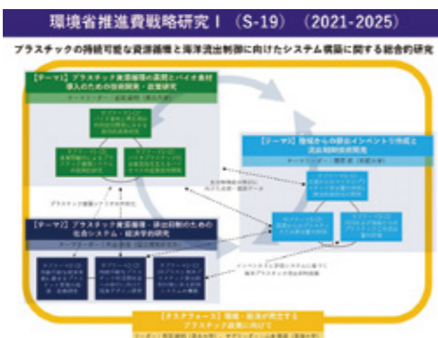
Fig.1 Systematization of halogen control technologies toward environmental impact reduction