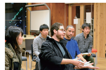
特別講義での質疑応答 Students making comments on a lecture