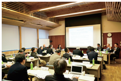
会議の様子 In the meeting with professors from universities in Japan