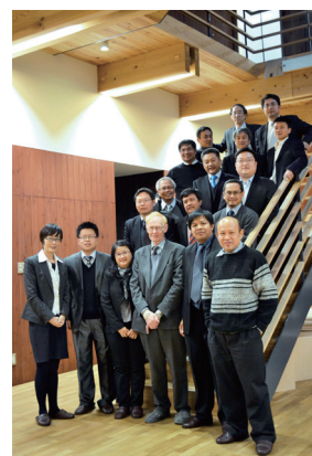
海外大学の関係者らと共に With all participants from abroad

Two environmental educational meetings were held in January and March. In January, experts from all over Japan discussed new phases in environmental education and research based on the worldwide initiative "Future Earth". Also in March, professors from five Asian countries were invited to talk about current and future environmental education.