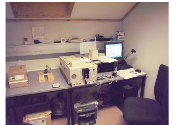
Fig. 7. FTIR instrument in AWI observatory.