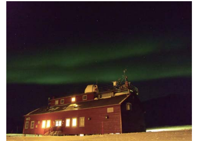
Fig. 5. AWI Observatory in Ny-Alesund under the aurora.

ノルウェー・ニーオルスンにおける極域成層圏雲の観測は、当研究科客員教授の国立環境研究所中島英彰研究官との共同研究で、本年度が3年計画の最終年度である。極域成層圏雲はオゾンホール発生の一因となるものであるが、その形状や性質が様々であり、未だ不明な点が多い。本観測では、地上からの分光観測、ライダー観測、気球観測などを組み合わせて極域成層圏雲の性質を調べる。ニーオルスンは北緯79度とほとんどの場合極渦内部に位置する国際的な観測基地である (Fig. 5)。今年度の観測は2010年12月下旬から2011年2月にかけて行われ、当研究室からは村田准教授が参加した。2011年1月5日には福岡大のOPC気球観測 (Fig. 6)、ライダー観測、FTIR観測 (Fig. 7) の同時観測に成功した。