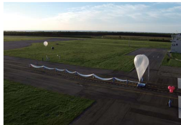
Fig. 2. Launch of the high-altitude balloon.

第2回国際北極研究シンポジウム(ISAR-2)は2010年12月7-9日に東京で開催され、15カ国から228名の参加者が集まった (Fig. 4)。この会議は2年前に第1回が行われ、日本・アジアのみならず欧米諸国からも北極域に関する研究者が集まり分