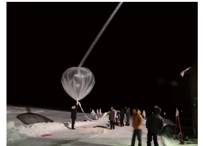
Fig. 6. Launch of OPC sonde.