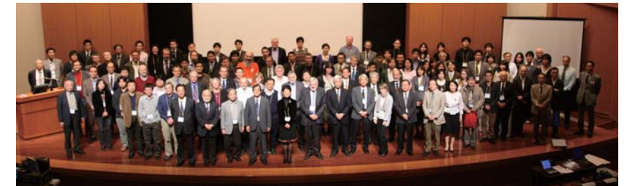
Fig. 4. Participants of the ISAR-2.